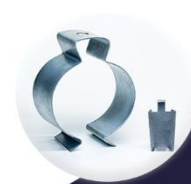
ABRAÇADEIRAS TIPO "D" C/ CUNHA