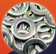
ARRUELA LISA DIN 125 ISO 7089