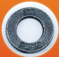
ARRUELA ASTM F436