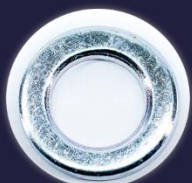
ARRUELA DIN 6916 (EN 14399-6)