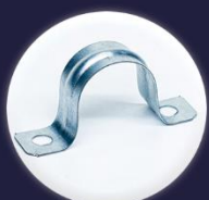
ABRAÇADEIRAS TIPO "U" ÔMEGA